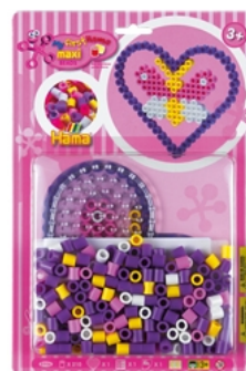
「ハマビーズ Jr. プリスターパック ハート」