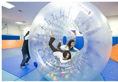
サイバーホイール