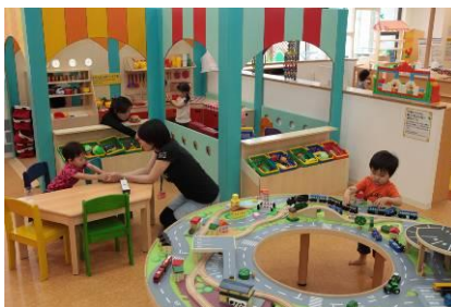
ごっこあそびコーナー