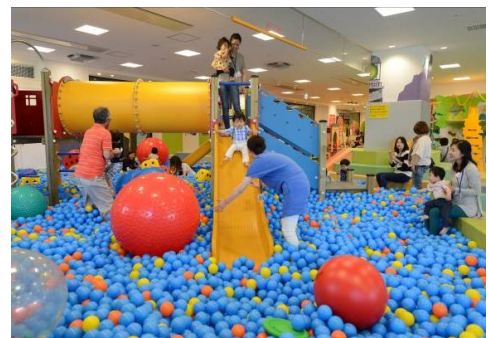
「キドキド」施設内イメージ

今回、より多くの方に「キドキド」のあそびを体感していただくために、親子でお得に遊べる2つの企画導入へと至りました。特に「岡山市3歳児全員招待企画」は、日常生活でできることが増え、走ったり物を運んだりと多様な体を動かすあそびにも対応できる時期に、親子一緒に遊ぶことで子どもの成長を見つめ、保護者が子育てに喜びを感じて楽しみながら取り組んでいただくことを狙っています。今後もボーネルンドは「キドキド」を通して、子どもがのびのびと自由に遊び、心身ともに健やかに育つあそび環境と、保護者同士が交流できる子育てコミュニティを提供して参ります。