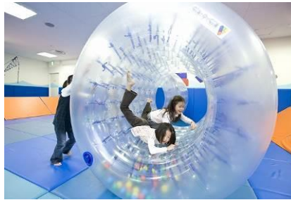
サイバーホイール