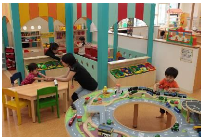
ごっこあそびコーナー