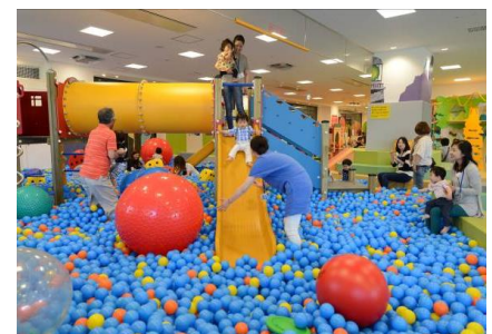
「キドキド」施設内イメージ

室内あそび場「キドキド」は、子どもたちの“ころ・頭・からだ”のバランスがとれた発育のため、運動大国デンマークの体育理論に基づいて開発したボーネルンドオリジナル遊具を中心に、子どもたちが発達段階に合った多様なあそびを存分に楽しめるよう工夫をこらして設計しています。「キドキド」の特徴である、常駐するあそびのプロ「プレイリーダー」が、あそびの見本を示して様々な体の動きを引き出し、親子のあそびをサポート。2004年の開業から来場者数を順調に伸ばし、昨年は年間243万人の親子が訪れました。「キドキド」は、親同士の交流や育児の情報交換を行う子育てコミュニティの場としても活用され、保護者からは「子育てに前向きに取り組めるようになった」といった感想が寄せられています。今後もボーネルンドは「あそび」を通じて、子どもがのびのびと自由に遊び、心身ともに健やかに育つあそび環境と、保護者同士が交流できる子育てコミュニティを提供して参ります。