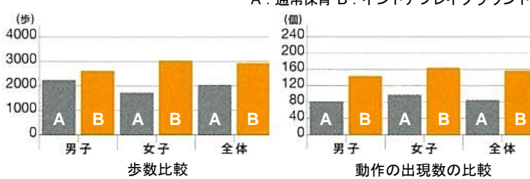
運動効果の実測データグラフ

当社は、子どもの遊ぶ機会の減少や身体能力の低下といった社会問題解消に向け、全身を使って多様なあそび体験ができる、親子の室内あそび場を展開しています。本施設は、通常保育と比較して歩数が約 1.5 倍、跳ねる・転がる・くぐるなどの動きの多様性は約 2 倍という高い運動効果や、子ども自身の高い満足度などからリピーターも多く、2014 年は年間 243 万人を超える親子にご来場いただいております。子育てに必須な施設として支持されています。