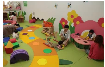
赤ちゃん専用コーナー