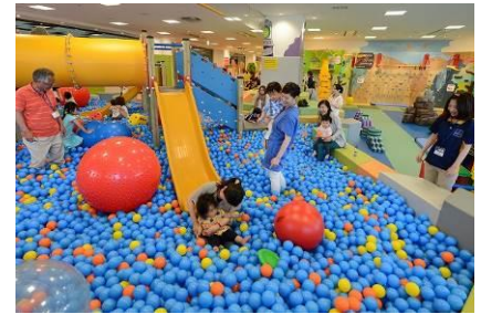
大型遊具とボールプール