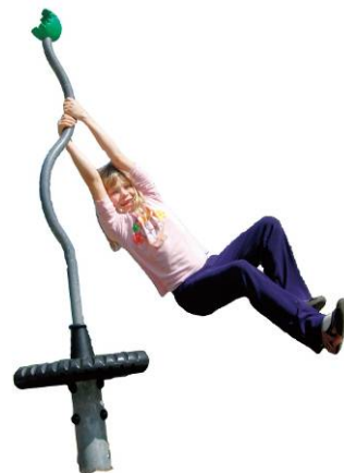
横回転遊具「スピカ」

11 月 9 日（水）10：15 よりテラスモール湘南主催のメディア説明会を実施、また 11：00～18：30 は施設内をご自由に内覧可能で、13：00～18：30 は遊ぶ子どもたちの様子も撮影いただけます。ご取材いただける際は下記までご連絡くださいますよう、よろしくお願い申し上げます。