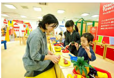
ごっこ遊びコーナー