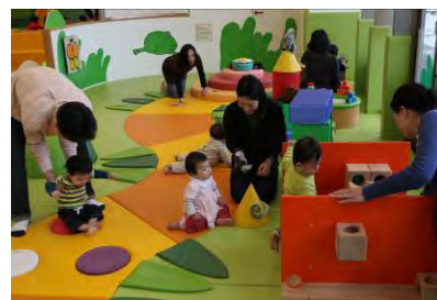
赤ちゃん専用コーナー