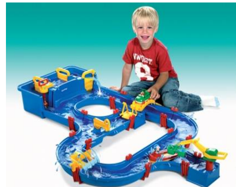
水遊び道具「アクアプレイ」