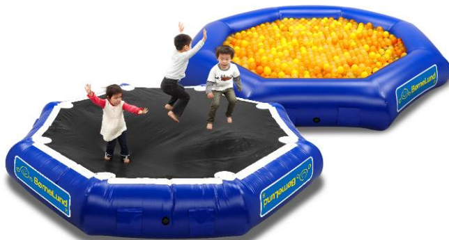
「キドキド」初登場遊具「ボールプールトランポリン」