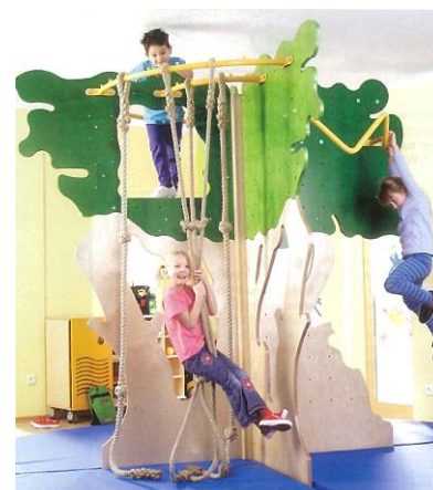
「キドキド」初登場遊具「木製うんてい」

広島市は、2005年度より子育て施策の強化に取り組んでおり、2010年度からは、「社会全体で子どもを育てる」考え方のもと、「広島市子ども施策総合計画」を策定し、様々な子育て支援施策を展開しています。その結果、2010年の合計特殊出生率は1.46と5年連続で増加、政令指定都市の中でも高い水準にあり、目覚ましい成果を挙げています。一方で、子どもたちの遊びの環境は決して充実しているとはいえない状況にあり、広島市が2009年に0～11歳児の保護者を対象におこなった調査*では、子どもの遊び場への不満として、「自然に触れ合える場がない」「近所に遊び場がない」「遊び仲間がない」といった回答が目立つほか、身近な場所の屋内あそび場について「ぜひ作ってほしい」と回答した未就学児の保護者は50.5%と半数を超えるなど、子どもの遊び環境の充実に、高いニーズがあることがうかがえます。