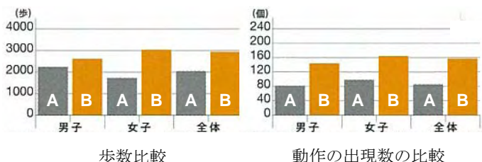
運動効果の実測データグラフ A：通常保育 B：インドアプレイグラウンド

当社は、子どもの遊び場の減少や身体能力の低下といった社会問題解消に向け、健全なからだづくりの基礎を育めるインドアプレイグラウンドを展開しており、今回で15ヵ所目の開業となります(7月6日に14ヵ所目となる「広島パセーラ店」が開業予定)。本施設は、通常保育と比較して歩数が約1.5倍、跳ねる・転がる・くぐるなどの動きの多様性は約2倍という高い運動効果や、子ども自身の高い満足度などからリピーターも多く、来場者数は好調に推移しています。