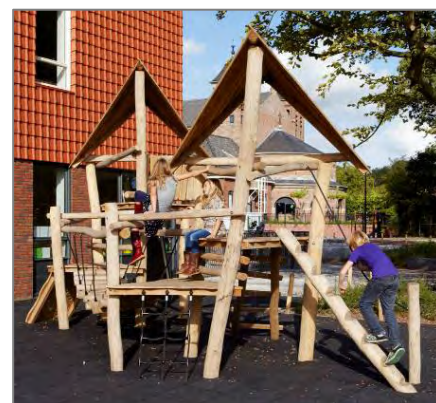
「キドキド」初登場の大型木製遊具 フォレスト・ツインタワー

「キドキド」最大規模の広さとなる約 660 m 2 の敷地を利用した場内には「サイバーホイール」や「エアトラック」といった全国の「キドキド」でおなじみの人気遊具のほか、渓谷に作られた吊り橋のようなブリッジを渡って遊ぶ大型木製遊具「フォレスト・ツインタワー」が日本初登場。このほか、よみうりランド周辺の自然豊かな情景を取り込み、子どもの創造力を広げる斬新な施設デザインに取り組むなど、これまでの「キドキド」にはなかった新しい試みにもチャレンジします。