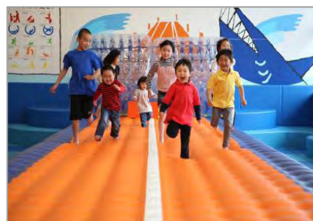
設置予定遊具：エアトラック