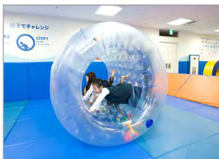
設置予定遊具：サイバーホイール