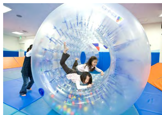
主な設置遊具（左：ブロックモジュール、右：サイバーホイール）