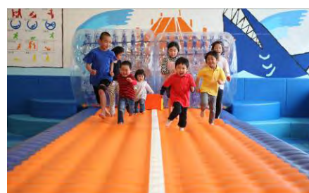
設置遊具イメージ(上)サイバーホイール (下)エアトラック