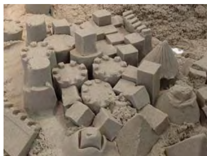
ダンシング・サンド