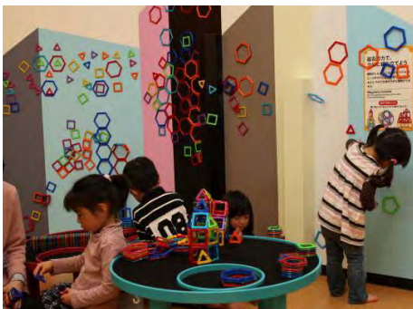
「アートの森」(イメージ)

当店では、これまでの「キドキド」で来場者の中心だった幼年齢向けだけでなく、学齢期向けにあそびの充実も図ります。体遊びでは子どもたちの挑戦心を刺激し、もぐる・這うなどの多様な動きを引き出す遊具を新たに設置します。じっくり取り組むあそびでは、壁面で磁石を使って遊ぶスペース「アートの森」を設置。色鮮やかなグラデーションカラーに色付けされたマグネットつき木製キューブを導入し、より高度なモザイク画を作って遊べます。3ヶ月替わりで色々な遊びを体験していただけるスペースもあり、オープン時は9月に一般家庭向けに新発売する「ダンシング・サンド」が登場予定です。「ダンシング・サンド」は、スウェーデン産の粒子の細かい砂に特殊加工を施し、まるで水を含んでいるかのようなしっとりした新しい触感で自由な造形あそびを楽しめる画期的な砂です。