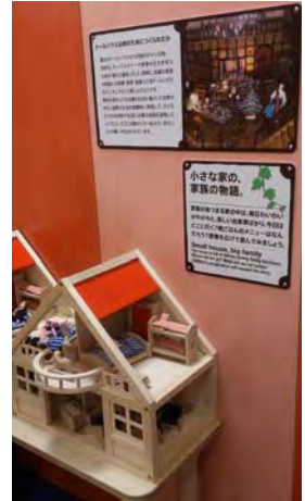
インストラクションイメージ

「キドキド」内には、ボール遊び、ごっこ遊び、自己表現するアート遊びなどといった各種の遊びについて、大人向けのインストラクションを設置。あそびの起源や文化的背景、あそびの効能などをより深く知ること、あそびの重要性を認識できます。