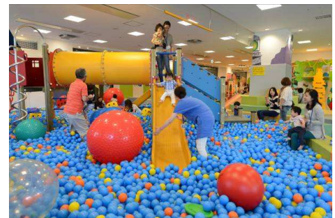
「キドキド」施設内イメージ

「キドキド」は、運動大国デンマークの体育理論に基づいて開発したボーネルンドオリジナル遊具を中心に、子どもたちが発達段階に応じた多様なあそびを存分に楽しめるよう、工夫をこらして設計しています。常駐する当社スタッフ「プレイリーダー」が、たくさんのあそびの見本を示して子どもたちのあらゆる体の動きを引き出し、親子のあそびをサポート。2004年の開業以降、来場者数は好調に伸び、昨年は年間約220万人の親子が来訪しました。子どもはのびのびと存分に遊び、親は子どもの成長を実感できる点が好評で、親同士の情報交換の場としても活用されており、子育てに必須の施設として全国の親子から幅広い支持を集めています。