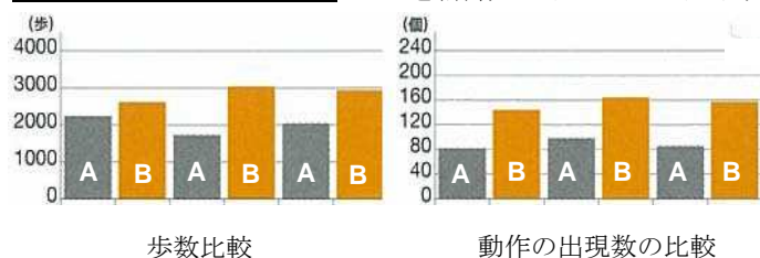
運動効果の実測データグラフ A: 通常保育 B: インドアプレイグラウンド

当社は、子どもの遊ぶ機会の減少や身体能力の低下といった社会問題解消に向け、全身を使って多様なあそび体験ができる、親子の室内あそび場「キドキド」を展開しています。本施設は、通常保育と比較して歩数が約1.5倍、跳ねる・転がる・くぐるなどの動きの多様性は約2倍という高い運動効果や、子ども自身の高い満足度などからリピーターも多く、2013年は年間220万人を超える親子にご来場いただいております。子育てに必須な施設として支持されています。