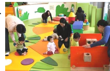
施設内あそび場イメージ

2012年4月1日より障害児支援の強化のため児童福祉法が一部改正され、障害を持つ子どもが身近な地域でサービスを受けられるよう、また学齢期における支援の充実のため、「児童発達支援」と「放課後等デイサービス」の創設が定められました。発達障害を持った子どもの放課後の居場所や、自由に遊べる環境が充分でない現状を受け、本施設運営主体の株式会社トレミーは、子どもたちが思いきり遊べ、保護者も一息つける場所を作りたいという思いから「多機能型 放課後等デイサービス Couleur（クルール）」を設立。法改正を受け、児童福祉支援の充実が推奨されていますが、発達障害児向けの支援施設は日常生活のサポートなどが一般的であり、幅広いあそび体験を中心にした発達支援は全国的にみても先駆的な事例です。室内あそび場「キドキド」を始め、あそび環境作りを実施してきたボーネルンドに、株式会社トレミーより本施設のあそび場作りをご依頼いただき、障害の有無にかかわらず、すべての子どもにあそび環境が保障されるべきと考えるボーネルンドは同社の思いに深く共感しました。また、同施設が提供する小学生を対象とした放課後等デイサービスと、体力低下やコミュニケーション力の向上のために、学齢期におけるあそびの必要性を訴求してきたボーネルンドの取り組みが一致し、今回のあそび環境プロデュースが実現。ボーネルンドでは今回の取り組みを経て、今後もあそびを通じた発達支援を推進して参りたいと考えています。