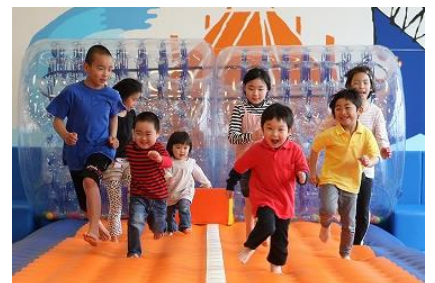
「キドキド」施設内イメージ

「キドキド」は、運動大国デンマークの体育理論に基づいて開発したボーネルンドオリジナル遊具を中心に、子どもたちが発達段階に応じた多様なあそびを存分に楽しめるよう、工夫をこらして設計しています。常駐するあそびのプロ「プレイヤー」が、あそびの見本を示してあらゆる体の動きを引き出し、親子のあそびをサポートします。2004 年の開業以降、来場者数は好調に伸びており、昨年は年間約 220 万人の親子が来訪しました。子どもはのびのびと存分に遊び、親同士の情報交換の場としても活用されており、全国の親子から幅広い支持を集めています。