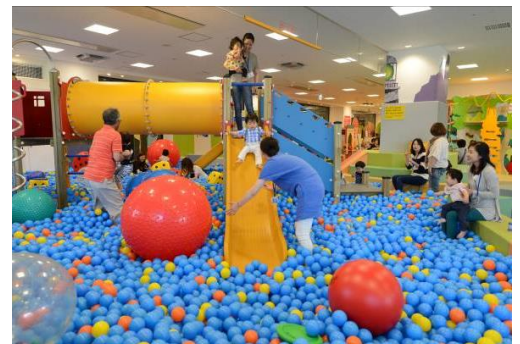
「キドキド」施設内イメージ

「キドキド」は、運動大国デンマークの体育理論に基づいて開発したボーネルンドオリジナル遊具を中心に、子どもたちが発達段階に応じた多様なあそびを存分に楽しめるよう、工夫をこらして設計しています。常駐するあそびのプロ「プレイリーダー」が、あそびの見本を示してあらゆる体の動きを引き出し、親子のあそびをサポートします。2004年の開業以降、来場者数は好調に伸びており、去年は年間約220万人の親子が来訪しました。子どもはのびのびと存分に遊び、親同士の情報交換の場としても活用されており、全国の親子から幅広い支持を集めています。