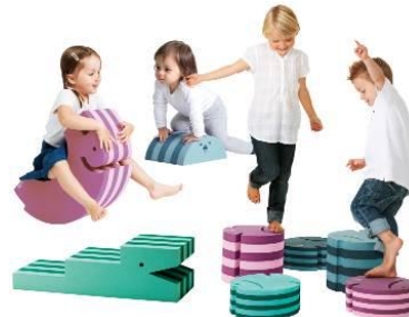
フォーム・アニマルズ