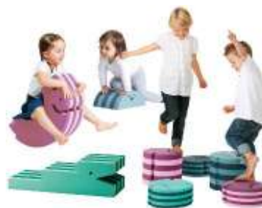
フォーム・アニマルズ