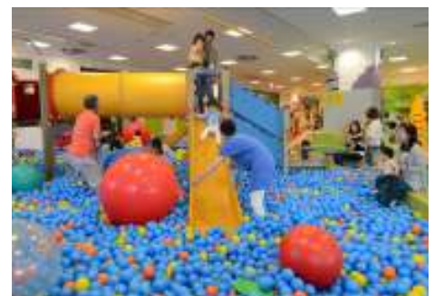
「キドキド」施設内イメージ

「キドキド」は、運動大国デンマークの体育理論に基づいて開発したボーネルンドオリジナル遊具を中心に、子どもたちが発達段階に応じた多様なあそびを存分に楽しめるよう、工夫をこらして設計しています。常駐するあそびのプロ「プレイリーダー」が、あそびの見本を示してあらゆる体の動きを引き出し、親子のあそびをサポートします。2004 年の開業以降、来場者数は好調に伸びており、昨年は約 220 万人の親子が来訪。子どもはのびのびと存分に遊び、親同士の情報交換の場としても活用されており、全国の親子から幅広い支持を集めています。