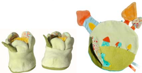
お花のベビーブーツ おしゃぶりタオル おうちと木

対象年齢:0歳頃～ 販売開始時期:7月上旬 商品サイズ:直径45cm 価格:¥2,625(税込) メーカー:ムーランロティ社(フランス)