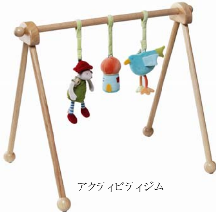
アクティビティジム

「ムーランロティ」はフランスで人気のブランドで、ぬいぐるみや生活雑貨など多種多様な商品を展開しています。今回、日本で初めて、下記商品の取り扱いを開始いたします。「ムーランロティ」社は、1972年に様々なバックグラウンドを持つ30名ほどの若者が共同で暮らし始め、自給自足のために作ったあそび道具からスタートしました。彼らの生活に根ざした鳥やネズミなどの山奥でよく見られる動物が多いことが象徴的です。途中、工場が火災で焼けてしまうなど幾多の困難を乗り越え、今では毎年約150万個の商品を世界40カ国以上に送り出しています。