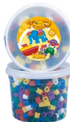
「ハマビーズ Jr. ミックスカラーボックス 基本色」