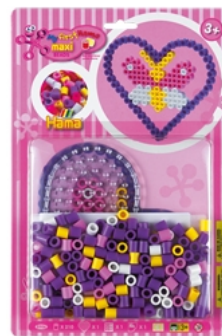
「ハマビーズ Jr. プリスターパック ハート」