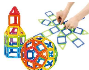
17アイテムに増える 数学ブロック「マグ・フォーマー」