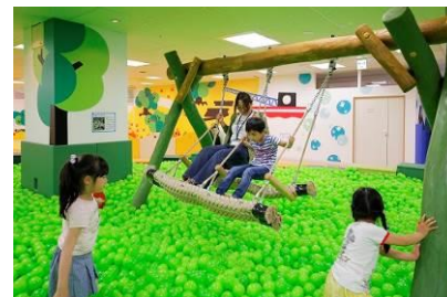
キッズランドおやま (栃木県小山市)