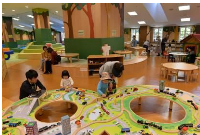
あかがねキッズパーク(愛媛県新居浜市)