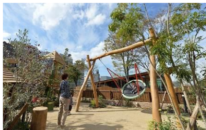
ボーネルンド プレイヴィル 天王寺公園(大阪府大阪市)

ボーネルンドのあそび環境創出事業は近年、子どもの健やかな成長をサポートするとともに、「子ども」や「ファミリー」をターゲットにした街の再生やビジネス上の集客に貢献する事例が増えています。公園の再生につながった「ボーネルンド プレイヴィル 天王寺公園」(大阪府大阪市)や、街の活性化に一役を担う「あかがねキッズパーク」(愛媛県新居浜市)、地方再生の切り札として3世代交流拠点としての役割を担う「キッズランドおやま」(栃木県小山市)など行政との取り組みの他、リゾート・ホテルや全国のカーディーラーのビジネスに貢献した事例など、その取り組みに広がりを見せています。ボーネルンドは今回の展示会を通じ、今後のビジネスのソリューションとしてあそび場活用のヒントをご提案いたします。