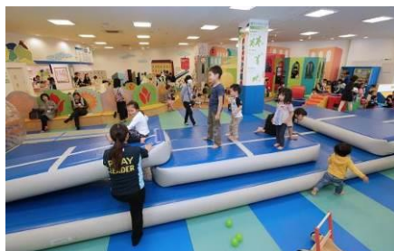
エアトラック・ファクトリー社のエアマット

最新の大型遊具として天然木のフォルムをそのまま使用したジク・ホルツ社(ドイツ)の遊具や、スペースに合わせてカスタマイズできるブル社(オランダ)の遊具、中型遊具はプロスポーツ界でも活用されている「エアトラック・ファクトリー」社(オランダ)のエアマット、子どもの身体ほどの大きさがあり子どもの自発性・創造性を促す「イマジネーション・プレイグラウンド」社(アメリカ)の大型ブロックをご紹介します。また最近日本でも公立小学校で使用され、教育現場での活用も期待される数学ブロック「マグ・フォーマー」の新商品13アイテムが勢ぞろいするほか、ドイツ・オランダ・フランスの教育現場で使用され、あそびを通して学ぶ楽しさを培う「ファンラーニング」シリーズの新商品、ベビー向け商材・クラフト商材の新商品も発表します。