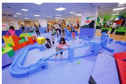
イマジネーション・プレイグラウンド社の大型ブロック