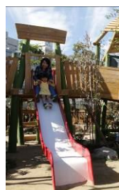
大型木製遊具(イメージ)

大型トランポリンで走ったりジャンプしたり転がったり、存分に体を動かして楽しめます。