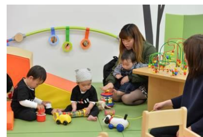
6～18か月の赤ちゃん専用スペース

赤ちゃんの興味を引き出すしつけが満載。赤ちゃんもママも安心してゆったり過ごせます。