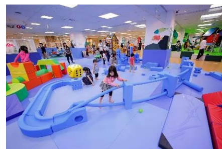
イマジネーション・プレイグラウンド 多様なモジュールを組み合わせて自由な世界を創造できる、最新型遊具。

キドキドでは、ダイナミックなからだあそび、創造あそびなど、子どもの成長に必要であっても既存の施設やご家庭ではなかなかできないあそびを揃え、子どもは多様な実体験を積むことができます。また、子どもの成長とあそびについて学んだ「プレイリーダー」が常駐し、親子のあそびをサポート。併設のショップではキドキドで使用している世界のアソビ道具を発達段階に即して取り揃え、お子様に最適なあそび道具を選ぶことができます。