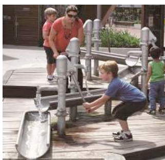
水遊びコーナー (イメージ)

施設の最奥には、木のマイスター集団、ドイツの「ジクホルツ社」による高さ6メートルもの大型遊具が日本初登場。登る、下りる、ぶら下がる、背伸びをする、バランスを取るなどの全身運動を、まるで自然の中で遊んでいるかのように体験することができます。