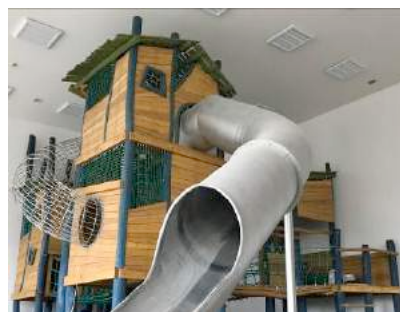
高さ6m！ドイツ・ジクホルツ社の 国内最大級遊具(イメージ)