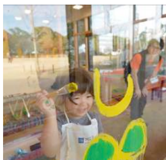
表現あそびコーナー (イメージ)