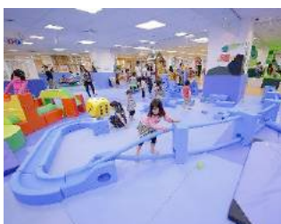
イマジネーション・ プレイグラウンド