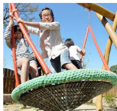
施設内イメージ。屋内にユニークなブランコも

キドキドでは、ダイナミックなからだ遊び、創造遊びなど、子どもの成長に必要なであっても既存の施設やご家庭ではなかなかできないあそびを揃え、子どもは多様な実体験を積むことができます。また、子どもの成長とあそびについて学んだ「プレイリーダー」が常駐し、親子のあそびをサポート。併設のショップではキドキドで使用している世界のあそび道具を発達段階に即して取り揃え、お子様に最適なあそび道具を選ぶことができます。