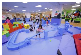
イマジネーション・プレイグラウンド