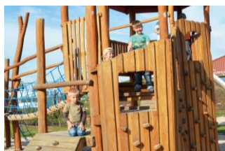
大型木製遊具 イメージ

なお、当店は、「ボーネルンド あそびのせかい」として、愛知県内で2店舗目の出店となります。ボーネルンドでは、今後も東海地区のあそび場開発事業を充実させていく予定です。