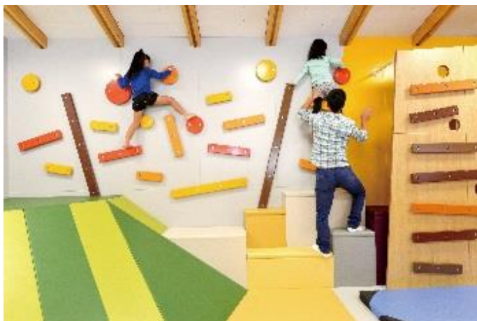
キドキド イメージ

一方のポーネルドショップは、妊娠期ママから小学校低学年までの子どものための、世界の優れた「あそび道具」を、最新の情報とともに提供するお店に生まれ変わります。2 ヶ月ごとにテーマを変える予定で、3 月は「アクティブラーニング」「赤ちゃんの眠り」にまつわる道具と情報をご紹介します。ただ商品を提案するだけではなく、インストラクターと一緒に親子で様々な遊び方を体験できるプレイテーブルも新設し、イベントも随時開催します。