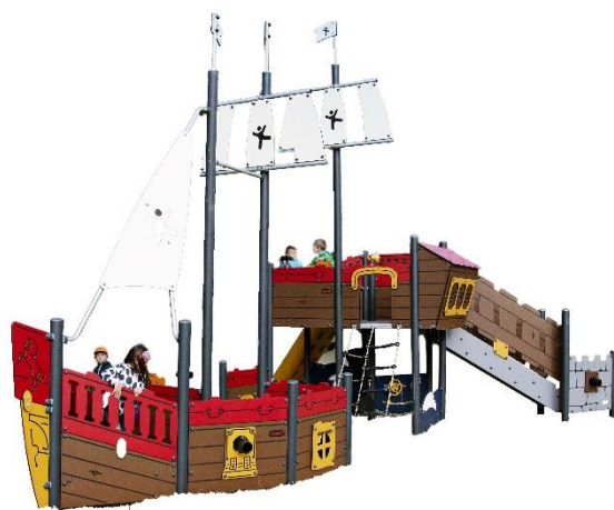
キドキド導入遊具 イメージ