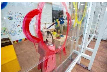
クリエイティブ・ファクトリー イメージ