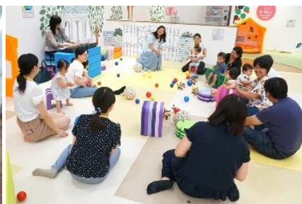
レインボー ワークショップイメージ