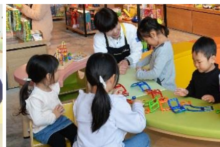
ポーネルドショップ イメージ