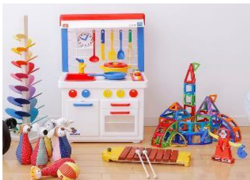
あそび道具イメージ