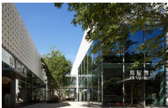
蔦屋書店 外観イメージ