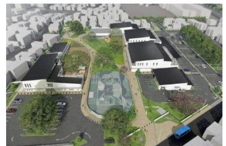
くまキッズ施設全体